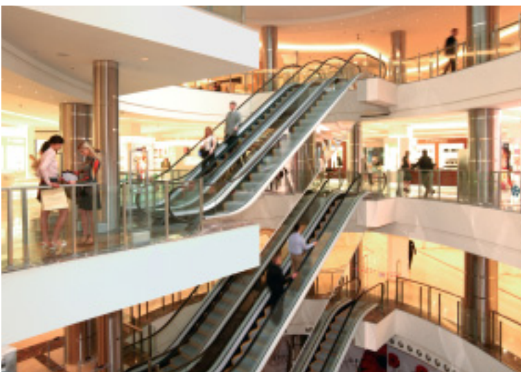
Bauherr: Einkaufszentrum Vesna, Moskau, RUS

Die hinter der Edelstahl- lochblechverkleidung sichtbare Mechanik ver- mittelt den Eindruck von Bewegung und Mobilität.