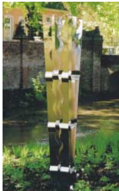
Ästhetik in Edelstahl live erleben

Die Informationsstelle Edelstahl Rostfrei wird auf der Deubau 2004 vom 13. - 18. Januar in Essen in Halle 1, Stand 1 - 510 , mit einer umfangreichen Broschürenpräsentation das Liefer- und Leistungsspektrum ihrer Mitgliedsunternehmen vorstellen. Außerdem informieren zahlreiche Merkblätter und Dokumentationen über die Anwendungsvielfalt des Werkstoffs Edelstahl Rostfrei. Zur Messe neu veröffentlicht wird die aktualisierte „Allgemeine Bauaufsichtliche Zulassung Z-30.3-6 für Bauteile und Verbindungselemente aus nichtrostenden Stählen“ vorliegen – eine unverzichtbare Planungunterlage für Architekten, Ingenieure und