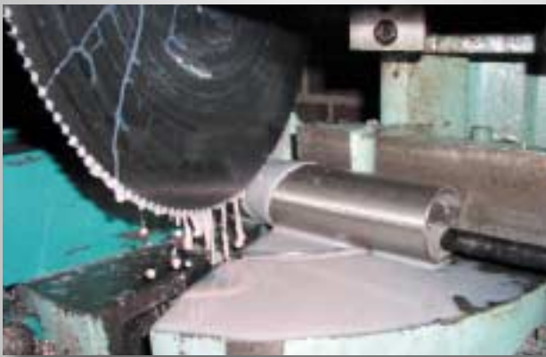
Sägen, Bohren, Biegen