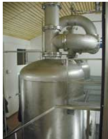
Nichtrostender Stahl im Wasserwerk Würzburg-Estenfeld

reitstellung, Wasseraufbereitung und Wasserverteilung sind zunehmend gefragt. Ergänzend hierzu ergeben sich mit Inkrafttreten der neuen Trinkwasserverordnung neue Anforderungen an die Materialauswahl bei Anlagen und Bauteilen in Kontakt mit Trinkwässern.