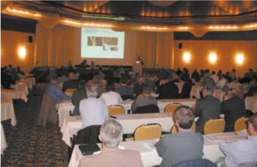
Interessierte Tagungsteilnehmer und praxisrelevante Informationen