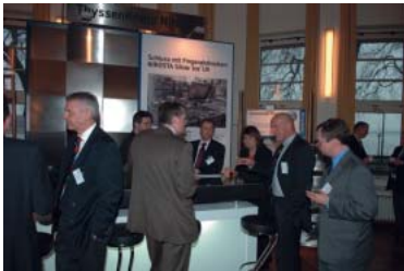
Ein wichtiges Gesprächs- und Informations-Forum für 16 Aussteller und 230 Teilnehmer bot die begleitende Fachausstellung

Am 9. und 10. März 2006 traf sich die Edelstahl-Branche in den Düsseldorfer Rheinterrassen, um sich über Innovationen und Trends rund um den Werkstoff Edelstahl Rostfrei zu informieren. Zu dieser Veranstaltung hatten die Informationsstelle Edelstahl Rostfrei, die Edelstahl-Vereinigung e.V., die Edelstahlhandels-Vereinigung und die Verlag Focus Rostfrei GmbH gemeinsam eingeladen.