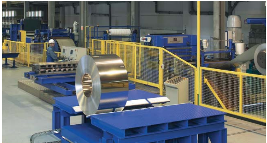
Die neue Querteilanlage verfügt über eine Hochleistungsrichtmaschine, die das Abrichten von 0,3 bis 3,0 mm dicken und 175 bis 1.000 mm breiten Edelstahlcoils ermöglicht

Bereitschaft, "ohne Wenn und Aber auf die individuellen Sonderwünsche der Kunden einzugehen" und dabei - falls nötig - auch den Anlagenpark anzupassen. Lagerhaltung für die Kunden und Just-in-time-Lieferung sind selbstverständlich.