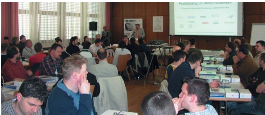
Anwendungsorientierte Vorträge sorgten für reges Interesse

Die neuen Broschüren können auf den ISER-Internetseiten in der Rubrik "Publikationen" eingesehen oder - wie immer kostenfrei - bei der Informationsstelle angefordert werden.