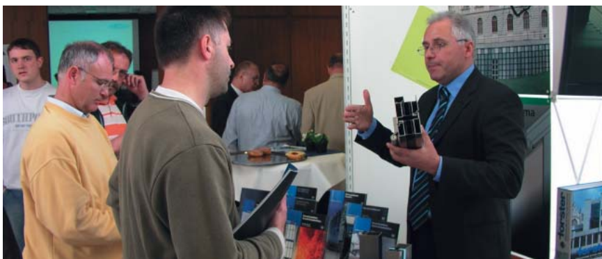
Viele der Teilnehmer nutzten die Informationsangebote der Aussteller