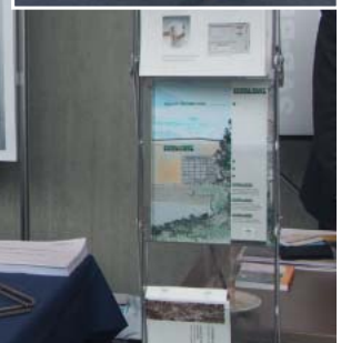
Fundierte Beratung und ein Werkstoff zum Anfassen - bei den Präsentationen der ISER steht Edelstahl Rostfrei immer im Mittelpunkt