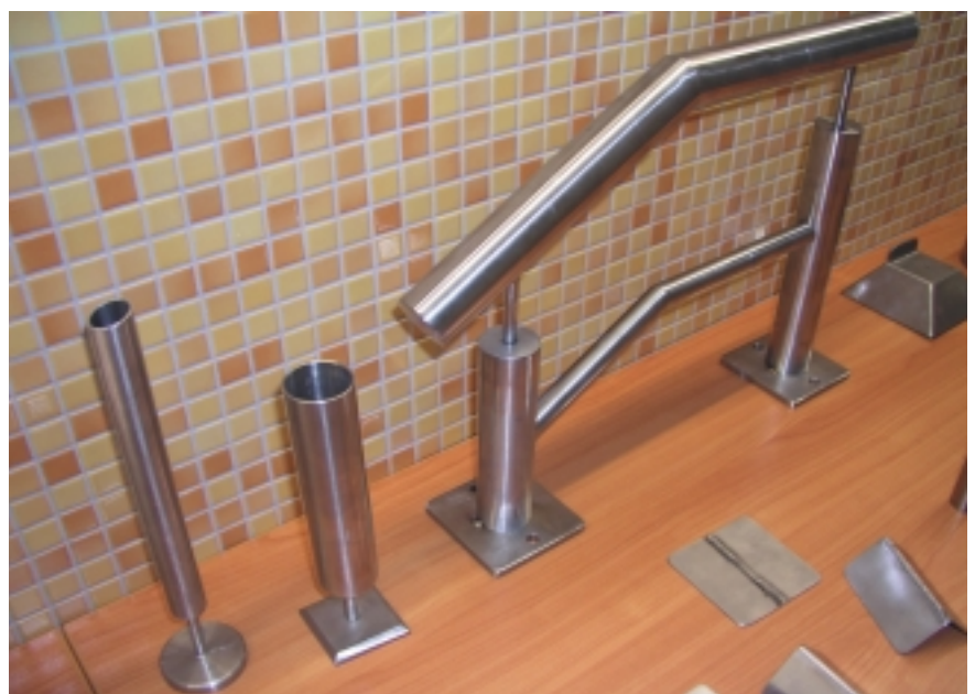
Ein großer Stundenanteil für die Be- und Verarbeitung von Edelstahl Rostfrei ist im Lehrgang METKT2/04 vorgesehen