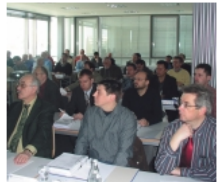
Fast 60 Personen waren der Einladung ins BTZ Ludwigshafen der Handwerkskammer der Pfalz gefolgt

Dass die Handwerkskammer der Pfalz mit diesem Konzept richtig liegt, bestätigen auch die bisher gemachten hausinternen Erfahrungen. Zur Zeit befinden sich die Inhalte noch in einer Erprobungsphase und in einer ständigen Anpassung an das Machbare. Bei Interesse sind weitergehende Informationen bei der Handwerkskammer der Pfalz (E-Mail: Rfaus@hwk-pfalz.de ) erhältlich.