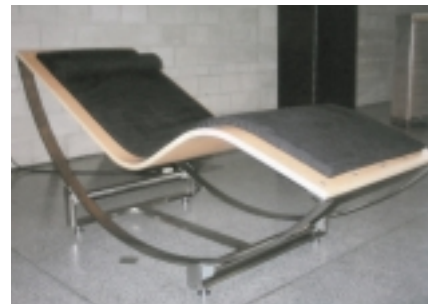
Liege (Oliver Hild)