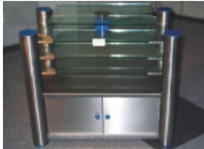
HiFi-Tisch (Christian Overthell)