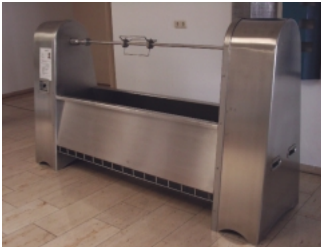
Spanferkellgrill (Alexander Badeke, Metallbau Uhlmann GmbH, Chemnitz)