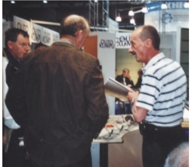
Praxisnähe ist immer gefragt – die Vorführungen zum Falzen und Weichlöten waren entsprechend gut besucht

Mit wachsendem Umwelt- und Qualitätsbewusstsein der Planer und Bauherren ist Edelstahl Rostfrei oft die technisch-wirtschaftlich optimale Lösung. Schwerpunkte der Präsentation waren: Beispielhafte Ausführungen für Flach- und Steildächer, Dachentwässerungssysteme, Vorführungen zum Falzen und Lötens von Edelstahl sowie innovative Befestigungstechnik. Das rege Interesse der Fachbesucher an der Gestaltungsvielfalt mit Edelstahl Rostfrei-Oberflächen veranschaulichte zudem einmal mehr die wachsende Bedeutung des nichtrostenden Stahls im Bedachungs- und SHK-Bereich.