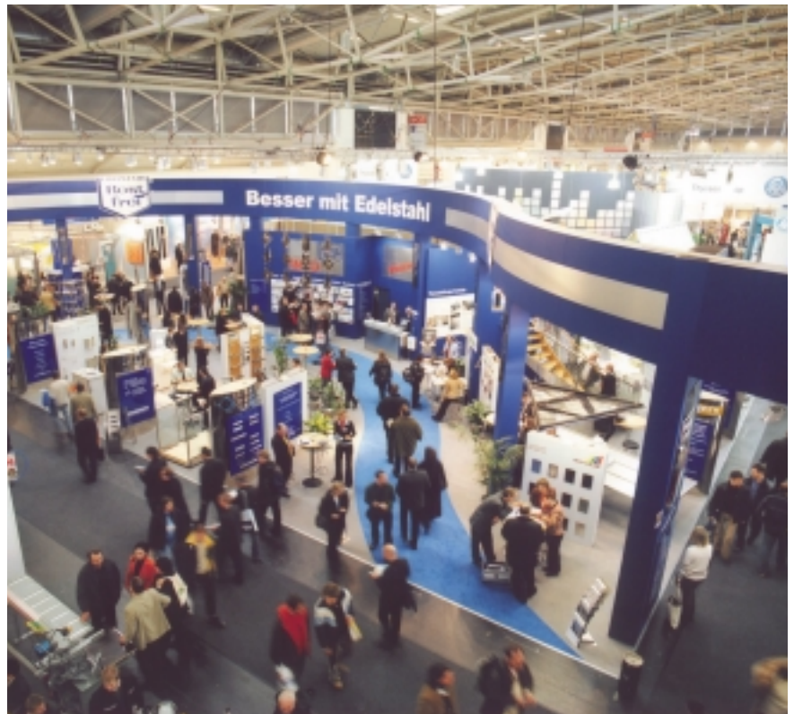
Großer Auftritt für Edelstahl Rostfrei: Gemeinschaftsstand mit 26 Ausstellern auf der BAU 2005

sind in der Architektur gefordert, um den steigenden Baukosten entgegenzuwirken. Besonders im Geländer- und Treppenbau werden zunehmend vorgefertigte Komponenten aus Edelstahl Rostfrei und zahlreiche Systemlösungen angeboten, z.B. als Nutrohr-Ganzglasgeländersystem oder als Stecksystem. Leichtbauelemente, Profil- und Kassettensysteme für Fassaden sowie durchdachte Befestigungssysteme erfüllen ebenfalls die Wünsche von Bauherren und Planern nach vereinfachter Montage und kürzeren Bauzeiten. Beliebt bei den zahlreichen Besuchern des Gemeinschaftsstandes "Besser mit Edelstahl" waren auch die gezeigten Komplettlösungen , z.B. für Solardächer, Flachdachsanieerung oder für hochwertige Sanitärausstattung. Eindrucksvoll wurde die ganze Palette der Oberflächenausführungen der nichtrostenden Stähle präsentiert. Neben neuen Dessins und