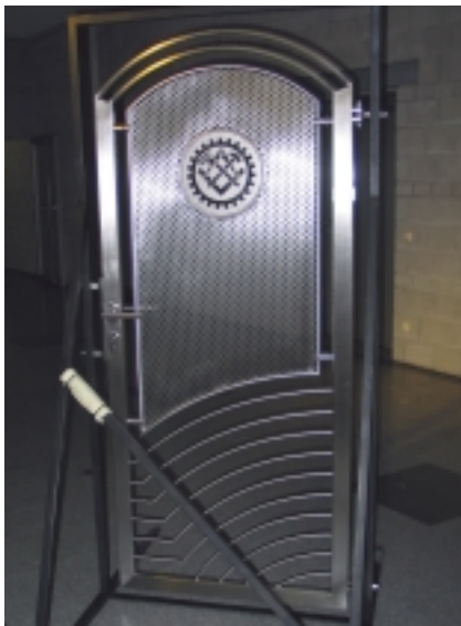
Tor (Andreas Schwemmer)