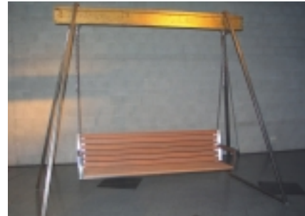
Schaukel (Hermann Jeißing)