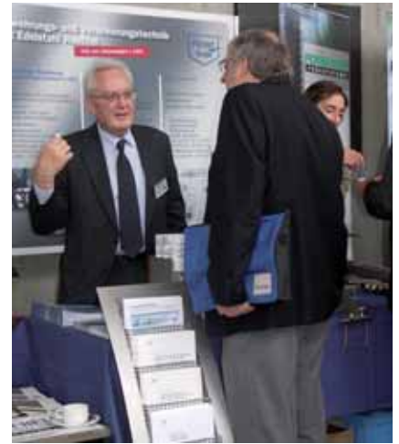
Viele der Fachbesucher nutzen das Informationsangebot der ISER.

2.000 Teilnehmer aus 25 Nationen und mehr als 150 Aussteller ist die positive Bilanz der 53. Beton-Tage, die vom 10. bis 12. Februar 2009 im Edwin-Scharff-Haus in Neu-Ulm stattfanden. Im Rahmen eines kleinen Messestandes präsentierte die ISER neueste Entwicklungen mit Edelstahl Rostfrei für die Bewehrungs- und Verankerungstechnik. Mit Hilfe fachkompetenter Beratung konnten wiederum interessante Bauprodukte und Anwendungen mit nicht-rostenden Stählen an zahlreiche Fachbesucher vermittelt werden.