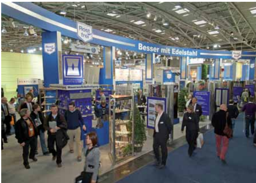
Das breite Spektrum der Bauprodukte aus Edelstahl Rostfrei überzeugte Tausende Fachbesucher aus Architektur- und Planungsbüros, Kommunen, Baustoffhandel und Bauhandwerk.

Die Informationsstelle Edelstahl Rostfrei war als kompetenter neutraler Ratgeber ebenso gefragter Ansprechpartner für Architekten, Planer, Bauherren, Designer, Metallbauer und Bauhandwerker wie die ausstellenden Unternehmen, die gemäß eigenen Aussagen bis zu 100 „sehr gute und vielversprechende Kontakte“ pro Messetag verzeichnen konnten. Volle Hallen, gute Stimmung, viel Zuversicht und intensive Gespräche an aufwendig gestalteten Ständen – das war das vorherrschende Bild auf dem Messegelände. Dieser durchweg positive Eindruck war auch auf dem Edelstahl-Gemeinschaftsstand erlebbar.