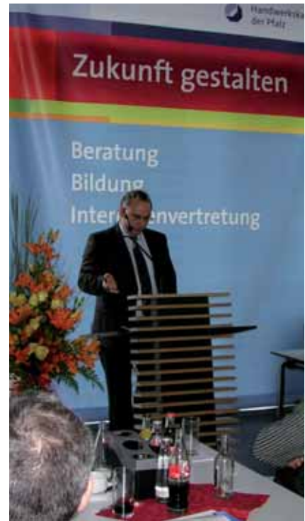
Weiterbildung als Innovationsinstrument – mit aktuellen Themen rund um Edelstahl Rostfrei stieß die Praktikertagung auf großes Interesse.