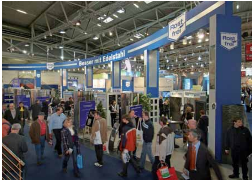
Auf über 400 qm realisierte die ISER wieder einen großen, erfolgreichen Branchenauftritt.

Ob neue Oberflächenausführungen für Flach- und Langprodukte, Sanierung